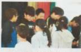
～1年生から6年生へ プレゼント!～

6年生からは、嵐の「Turning up」のダンスが披露されました。難しいステップも見事でした。