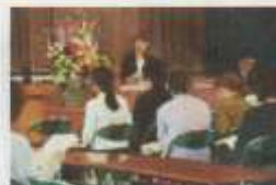
【昨年度の総会の様子】

また、授業参観の後、体育館で「PTA総会」「学校説明会（令和2年度坂部小学校の教育について）」が行われます。よろしくお願ひします。