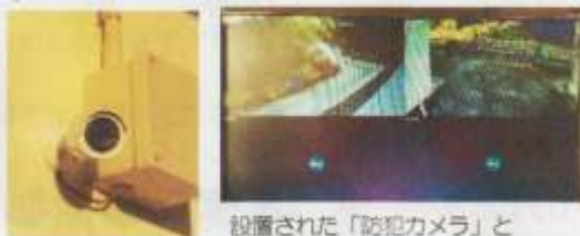
設置された「防犯カメラ」と「モニター」

子供たちが安全に学校生活を送ることができるように「児童昇降口から正門方向」「体育館通路から西側通用門方向」の2箇所「防犯カメラ」が設置されました。モニターは事務室にあり、常に監視できるようになっています。また、録画もされているため24時間の監視が可能となっています。