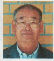
スクールサポートスタッフ