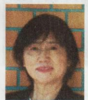
学習支援サポーター