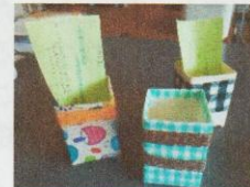
【感謝の気持ちを伝えよう大作戦の様子】