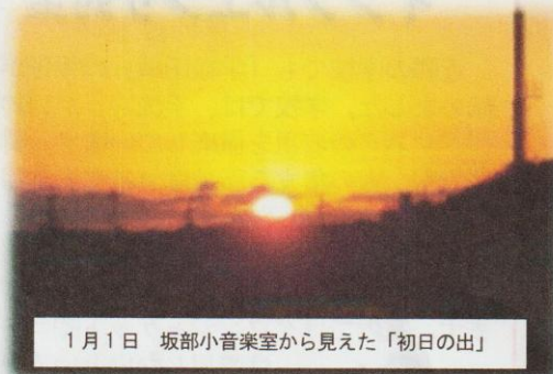
1月1日 坂部小音楽室から見た「初日の出」

平成30年度も残すところあと3ヶ月。次の学年につなげていくために、一日一日を大切に、実りあるものにしていきます。引き続き、皆様の御協力をお願いいたします。