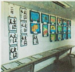
【チャレンジ発表展】

夏休みのがんばりを伝える場として各教室で「チャレンジ発表会」が、区民センターでは「チャレンジ発表展」が開催されました。