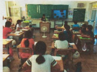
【チャレンジ発表会】

作品づくりで工夫したところやがんばったところ、自由研究でまとめたことの発表など、どの子も自信をもって発表をしていました。また、区民セン