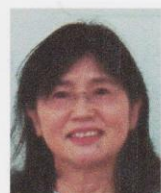
学習支援サポーター