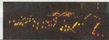
【浮かび上がった「坂小なかよし」の文字】

5日間、テレビもゲームもない生活で普段よりも多く友達と関わることができました。その中で、友達のことを思いやったり、自分にできることをすすんで行ったりする姿がたくさん見られました。PTAをはじめ仲よし学校の運営に携わっていただいた多くの皆様へ感謝申し上げます。